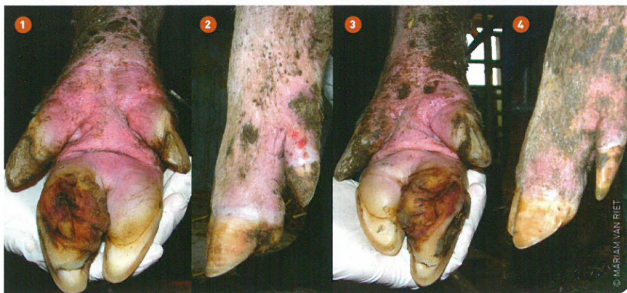
Figuur 2 Voorbeelden van mogelijke aandoeningen aan klauwen. 1 erosie en zoolscheur, 2 verticale scheur en huidbeschadiging rond de klauw, 3 wittelijnp probleem, zoolscheur met erosie en ongelijke klauwlengte, 4 zijaanzicht gezonde klauw.

vestingsperiode tot aan de verplaatsing naar de individuele kraamstal. Deze stijging was echter minder uitgesproken voor de zeugen gehuisvest in de hokken met rubberen vloeren. Het vloertype had ook een effect op de klauwscores van de dieren: tijdens midden-groepshuisvesting waren er minder heftige aantastingen van de balhoorn en van de overgang van de balhoorn naar de zool bij zeugen gehuisvest op rubberen vloeren. Echter, op hetzelfde moment hadden de dieren in hokken met rubberen toplaag ergere verticale scheuren in de klauwen, maar aan het einde van de groepsstalperiode was dit verschil niet zichtbaar meer.